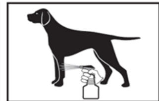
5 Kleiner Sprühstrahl für Pfoten und Hautfallen beim stehenden Tier