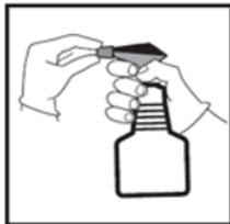
1 Sprühdüse einstellen