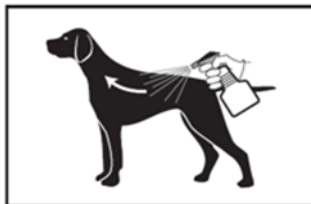
2 Entgegen dem Haarstrich sprayen, Tier dabei festhalten